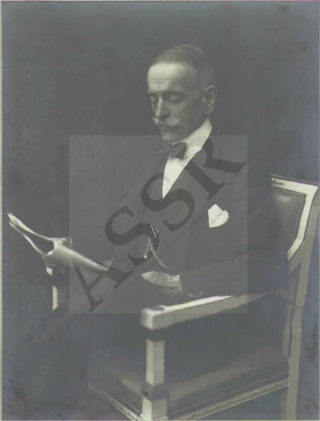
D'Alife Gaetano Nicola Senatore del Regno.